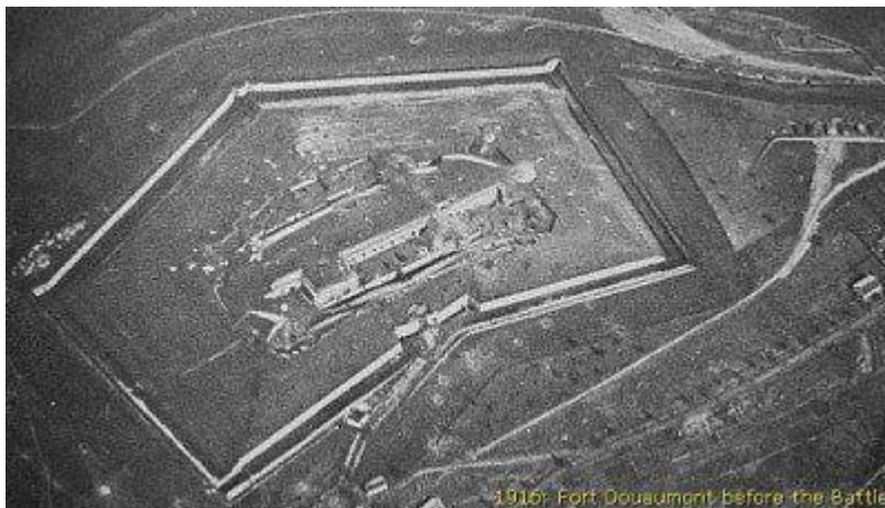
1916: Fort Douaumont before the Battle